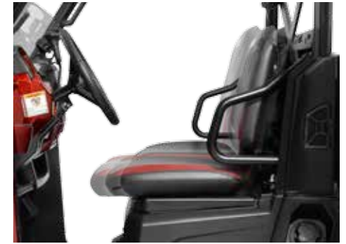
Verstelbare stoelen voor extra zitgemak