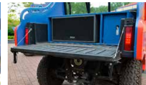
De boxen passen mooi in de laadbak van de Ranger

per dag geven 2 personen met 2 Rangers een muziekshow in het park waarbij flink gedanst wordt. "Echt iedereen is enthousiast als wij optreden met onze Rangers. De vraag komt ook vaak waar deze te koop zijn, maar een volledig omgebouwde Ranger EV is door ons zelf gemaakt en niet als zodanig in de winkel te koop", aldus Sebastian. Voor Walibi was de keuze voor een Polaris Ranger EV snel gemaakt. Een Side by side moet niet alleen sterk, maar ook betrouwbaar en stil zijn. Hij moet sterk zijn omdat de opbouw met speakers en versterkers al snel zo'n 300 kilo weegt. Daar komen nog een bestuurder en passagier bij en nog wat losse spullen. De 30pk/ 48V wisselstroom motor is dan ook uiterst krachtig en heeft geen enkele moeite om de Ranger vlot te verplaatsen. De Ranger EV is ook door iedereen eenvoudig te gebruiken. Op het dashboard zien we verschillende schakelaars waaronder die voor 4Wd, maar die wordt nooit aangeraakt. Nee, enkel de volumeknop gaat niet zelden naar standje 10 zodat de bezoekers uitiem kunnen genieten van de muziek die uit de speakers van de Rangers komt. Een ongewone sensatie op een amuserende plek in het hart van België.