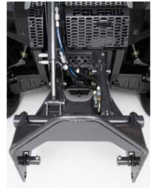
Pro-Tach systeem. Snel en makkelijk hydraulische werktuigen verwisselen.