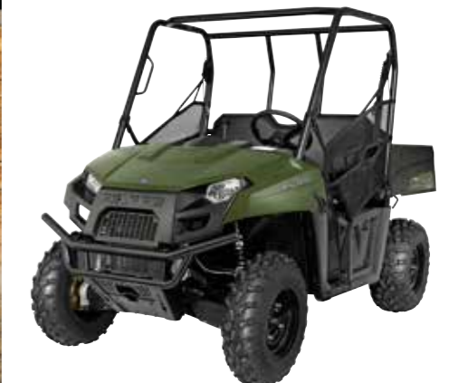
Stevige kooiconstructie voor optimale stevigheid