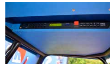
De bediening van de muzikinstallatie ingebouwd aan het plafond

Achterin het park is een speciale laadruimte gemaakt met afdak waar de Rangers staan geparkeerd en constant worden opgeladen. Zo'n 4 keer