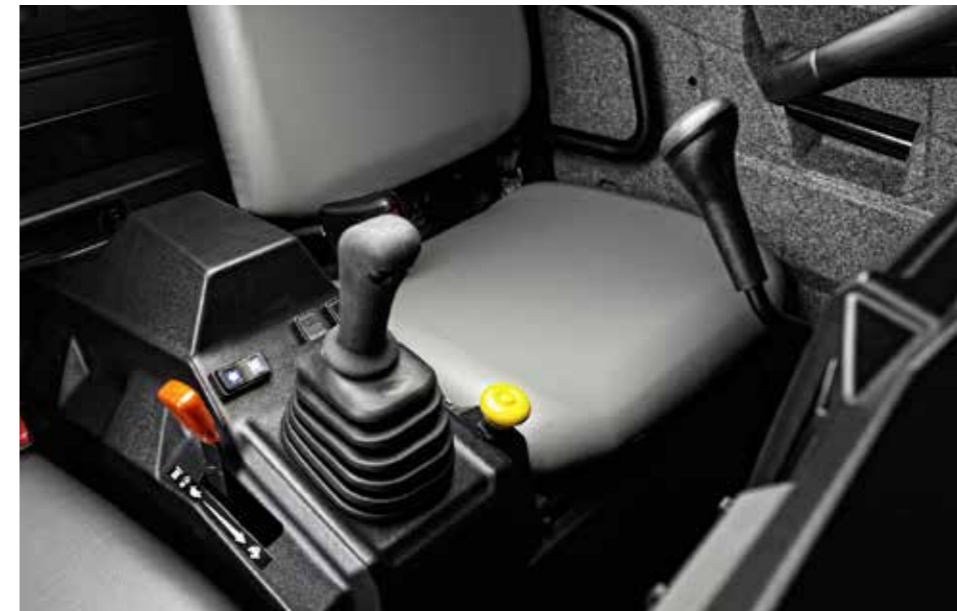
Alle functies binnen handbereik

zorgen hiervoor. Het dashboard is centraal voor de bestuurder geplaatst om zo de informatie in één oog opslag waar te nemen. Het Lock&Ride Pro Fit Cab systeem zet de standaard in deze klasse. De vele werktuigen en het gemak waarmee ze bediend kunnen worden, maakt van de Brutus een all-round inzetbaar werkpaard. De sneeuwschuiver, heflepels, veegborstel en het maaidek worden aangedreven door de PTO van de Brutus en zijn met het hydraulische systeem eenvoudig te installeren, bedienen en demonteren. Alle werktuigen hebben dezelfde kwaliteit die men van Polaris verwacht en zijn pasklaar.