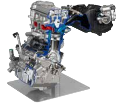
De nieuwe Polaris ProStar 900cc motor

De totaal nieuwe Polaris ProStar 900cc motor levert 60pk en heeft een indrukwekkend koppel en trekkracht. De soepelste en best reagerende elektronische stuurbechrachting die te verkrijgen is. Bij lage snelheid past de stuurbechrachting zichzelf aan. Door het EPS kun je langer door werken of rijden zonder snel vermoeid te raken. De motor zit onder de laadbak waardoor hij minder geluid maakt. Hij is soepel bij alle toerentallen en heeft dubbele bovenliggende nokkenassen (DOHC), een 180 graden krukas en geïsoleerde motor en versnellingsbak. Het motormanagement systeem levert optimaal koppel en pk's bij alle